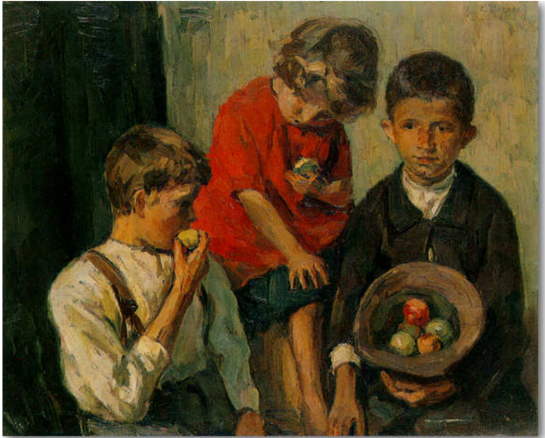
Δούκας Έκτωρ, Παιδιά με Μήλα, 1930