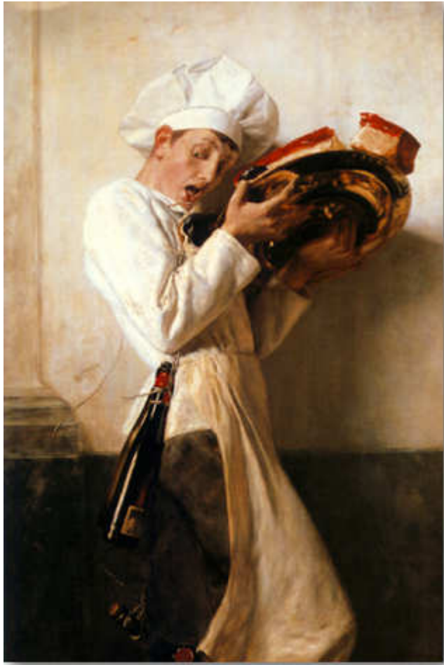
Γύζης Νικόλαος, Ο ζαχαροπλάστης, 1898