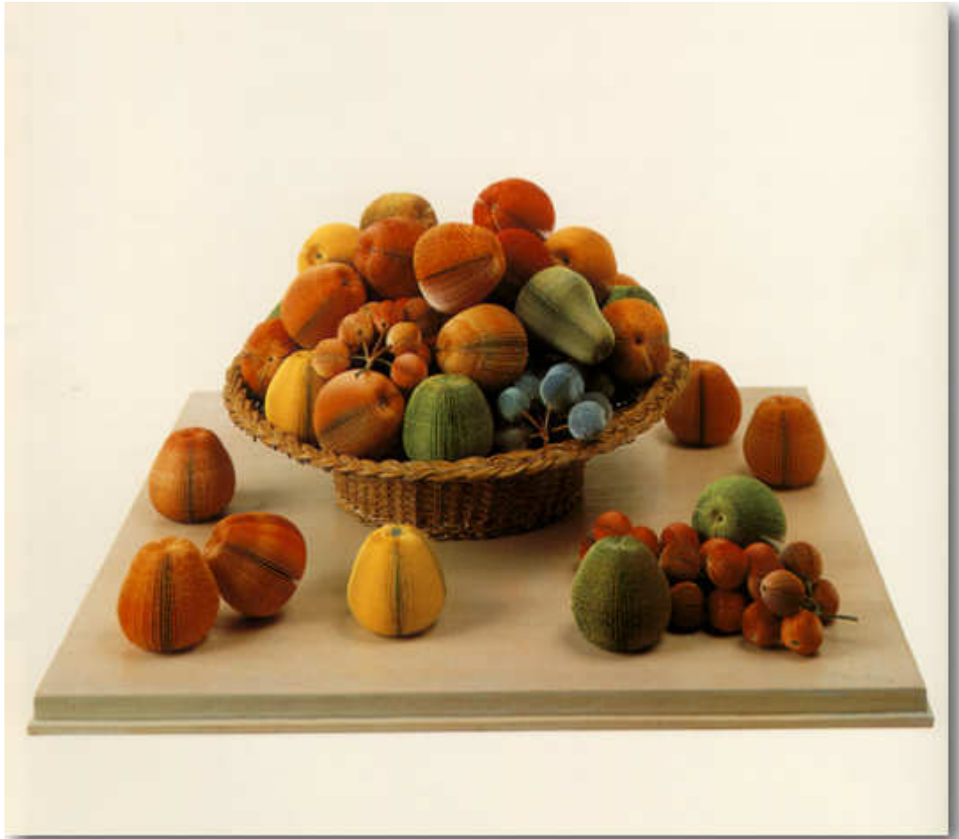
Παύλος (Διονυσόπουλος), Νεκρή Φύση, 1991 , (χάρτινη κατασκευή σε ξύλινη βάση)