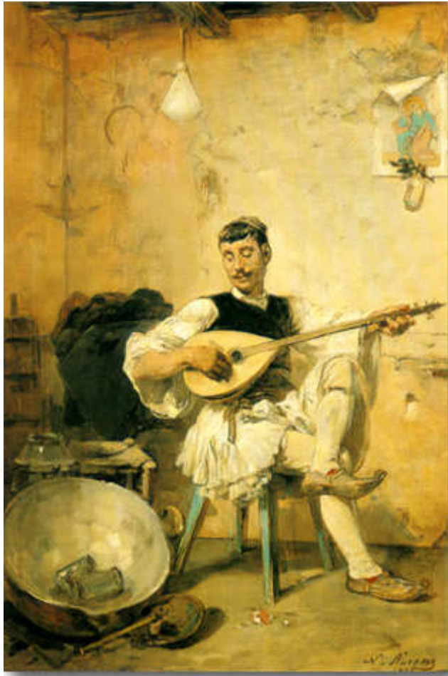
Λύτρας Νικηφόρος, Ο Γαλατάς, 1895