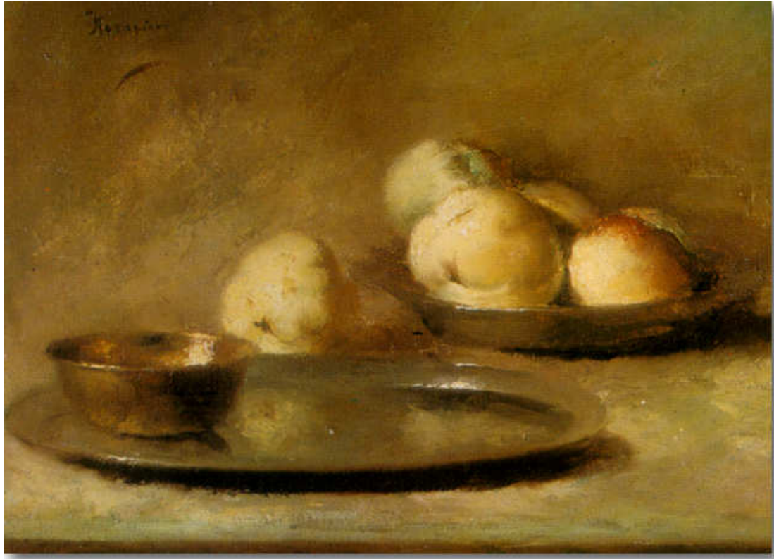
Ποταμιάνος Χαράλαμπος, Νεκρή Φύση, 1947