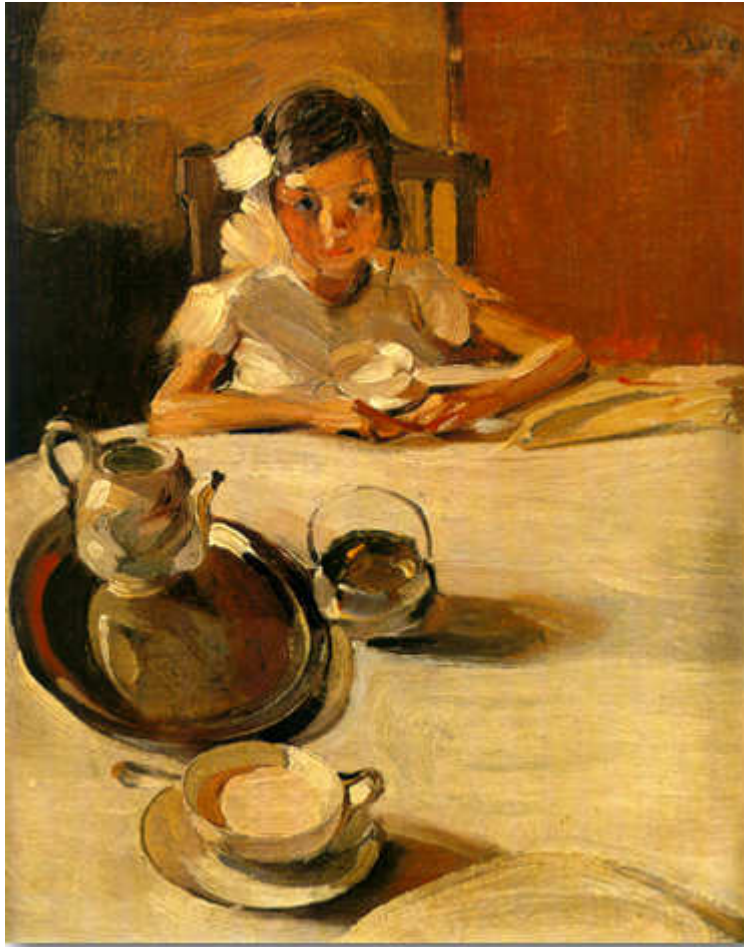
Λύτρας Νικόλαος, Το Γάλα, 1917