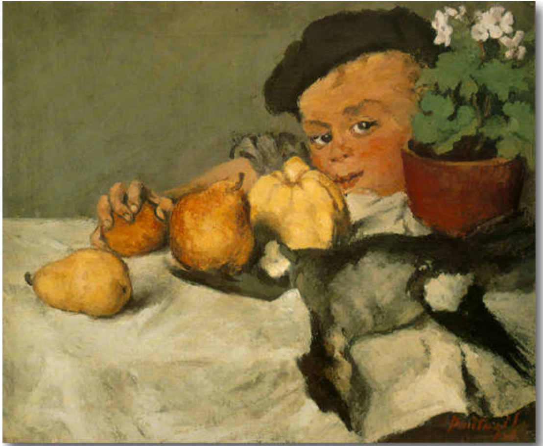
Πανταζής Περικλής, Ο Μικρός Κλέφτης, 1882