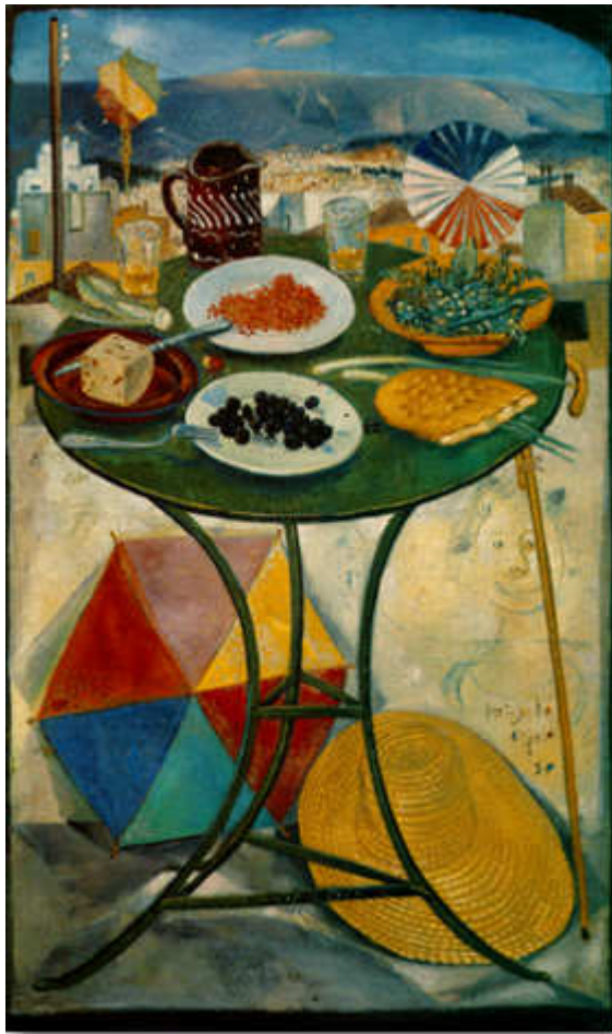
Βασιλείου Σπύρος, Το Τραπέζι της Καθαρής Δευτέρας, 1950