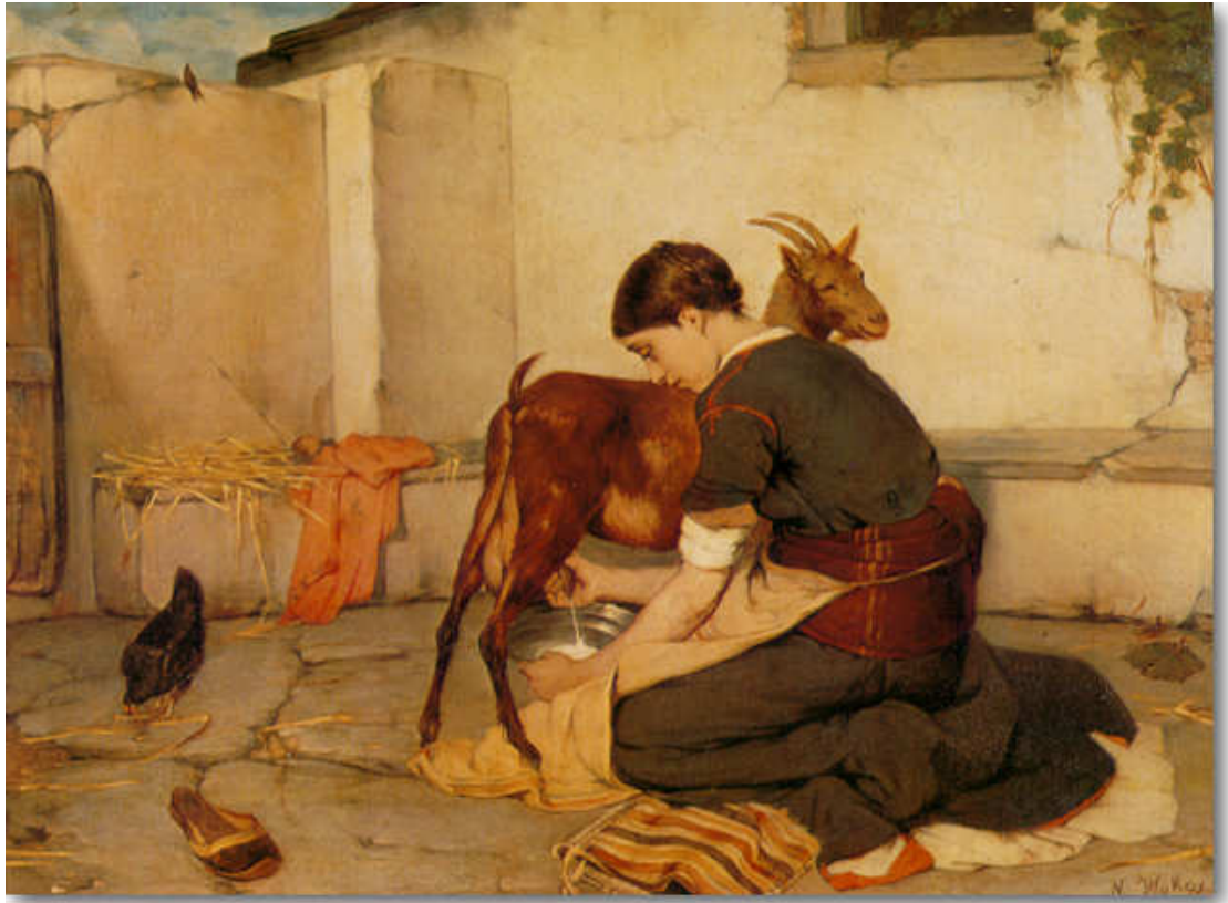
Βώκος Νικόλαος, Το Άρμεγμα της Κατσίκας, 1895